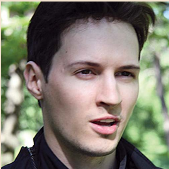
Фото Дурова с его странички «ВКонтакте»

На прошлой неделе гендиректор «ВКонтакте» Павел Дуров обнародовал официальный запрос от Петербургского управления ФСБ, в котором ему настоятельно рекомендовали заблокировать оппозиционные сообщества. Тут же, в «Твиттере», Дуров опубликовал и официальный ответ.