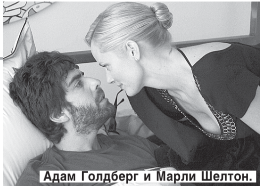
Адам Голдберг и Марли Шелтон.