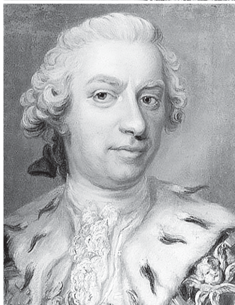
«Не ведаю. Но предо мной тогда раскрылись грядущие года...» Граф Генингс Адольф Гюлленборг (1713 — 1775), отменный оратор и добрый наставник будущей русской властительницы (художник Густав Лундберг, XVIII век).

слабляющему влиянию высшего света, где купаются в роскоши и удовольствиях? Ваша голова, моя милая, забита туфлями и нарядами. Держу пари: вы не брали и книгу в руки с того момента, как пересекли в санях русскую границу!» — «Ну, пожалуй, так, — согласилась Фике, — но я и дома, в Померании, признаться, читала лишь то, что требовали родители и гувернантки. Я до одури носилась в городском саду с простыми ребятишками — детьми сапожников и булочников — и была их бессменным коноводом. А наипаче всего любила возиться с оружием и стрелять в воздух. Никто и в мыслях не допускал, что я стану невестой русского престолонаследника». — «Экие у вас скелеты в шкафу! — воскликнул посол. — Вы созданы, сударыня, для громких подвигов, а не заемного ребячества. Я укорял герцогиню Иоганну за явный недостаток внимания к вам. София, сказала я, поистине уникальный ребенок — гораздо старше и рассудительнее своего возраста, и ей нужна постоянная, трепетная забота. Да и сейчас, наедине, готов добавить: 15-летний философ не может знать себя досконально. Вы, дорогая, окружены столькими подводными камнями: о них легко разбиться, причем вдребезги, если душа ваша не закалена на исключительном огне. Ее следует питать лучшим, изысканным чтением». — «Хорошо. Какие книги были бы рекомендованы мне для на-