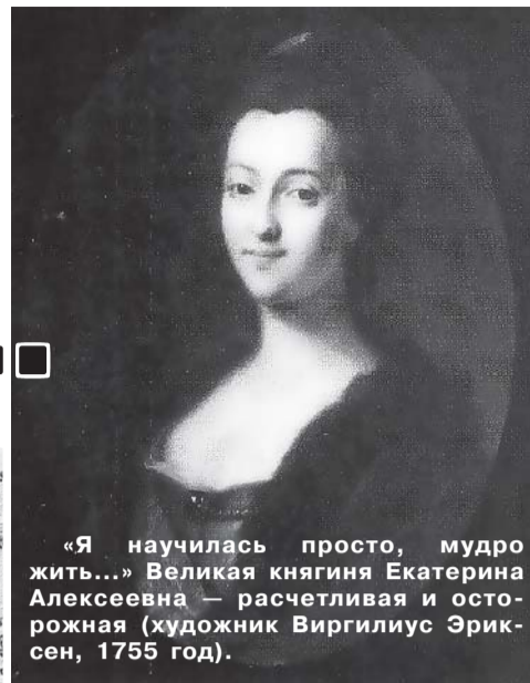
«Я научилась просто, мудро жить...» Великая княгиня Екатерина Алексеевна — расчетливая и осторожная (художник Виргилиус Эриксен, 1755 год).

слабляющему влиянию высшего света, где купаются в роскоши и удовольствиях? Ваша голова, моя милая, забита туфлями и нарядами. Держу пари: вы не брали и книгу в руки с того момента, как пересекли в санях русскую границу!» — «Ну, пожалуй, так, — согласилась Фике, — но я и дома, в Померании, признаться, читала лишь то, что требовали родители и гувернантки. Я до одури носилась в городском саду с простыми ребятишками — детьми сапожников и булочников — и была их бессменным коноводом. А наипаче всего любила возиться с оружием и стрелять в воздух. Никто и в мыслях не допускал, что я стану невестой русского престолонаследника». — «Экие у вас скелеты в шкафу! — воскликнул посол. — Вы созданы, сударыня, для громких подвигов, а не заемного ребячества. Я укорял герцогиню Иоганну за явный недостаток внимания к вам. София, сказала я, поистине уникальный ребенок — гораздо старше и рассудительнее своего возраста, и ей нужна постоянная, трепетная забота. Да и сейчас, наедине, готов добавить: 15-летний философ не может знать себя досконально. Вы, дорогая, окружены столькими подводными камнями: о них легко разбиться, причем вдребезги, если душа ваша не закалена на исключительном огне. Ее следует питать лучшим, изысканным чтением». — «Хорошо. Какие книги были бы рекомендованы мне для на-