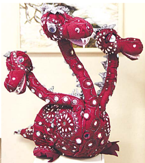
Русский дракон — трехголовый Змей Горыныч.