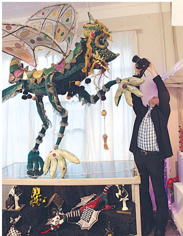
Все хотят сфотографировать самого большого дракона.