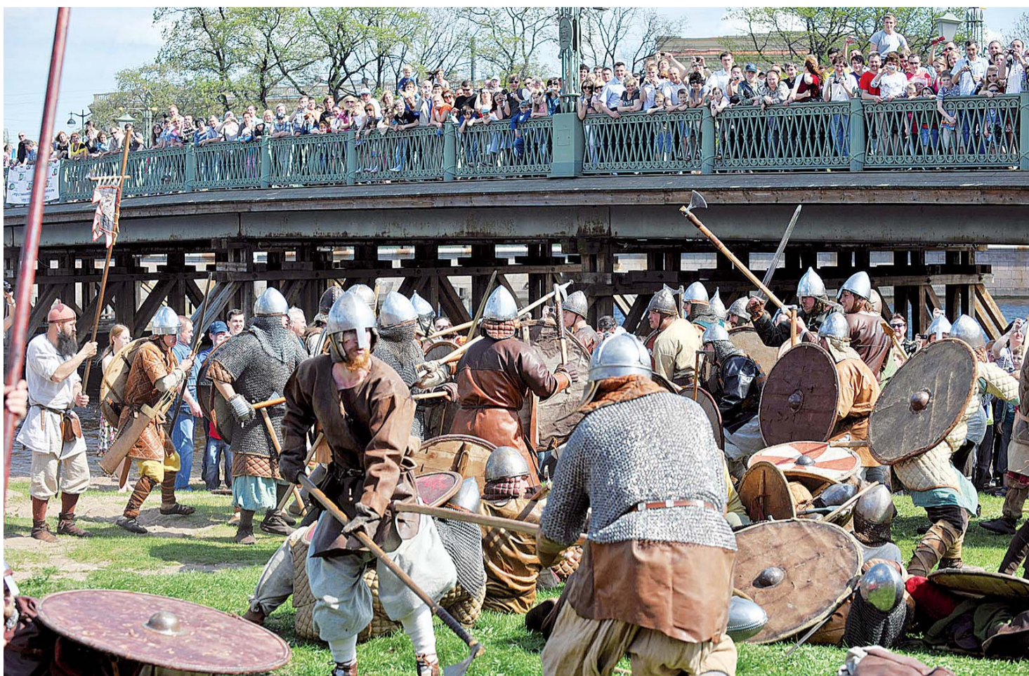
Реконструкции исторических битв ныне популярны. Подобные действия всегда красочны и собирают толпы зрителей.