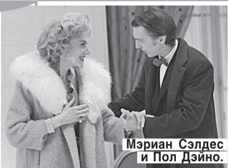
Мэриан Сэлдес и Пол Дэйно.