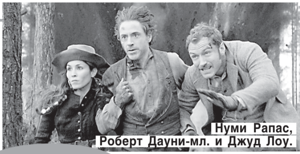
Нуми Рапас, Роберт Дауни-мл. и Джуд Лоу.

ИРОНИЧЕСКИЙ БОЕВИК. Когда кронпринц Австрии был найден мертвым, все улики, по мнению инспектора Лестрейда, указывали на самоубийство. Но Шерлок Холмс приходит к выводу, что наследник престола был убит, и это убийство — всего лишь маленький кусочек мозаики, созданной профессором Мориарти и на самом деле гораздо более грандиозной и зловещей.