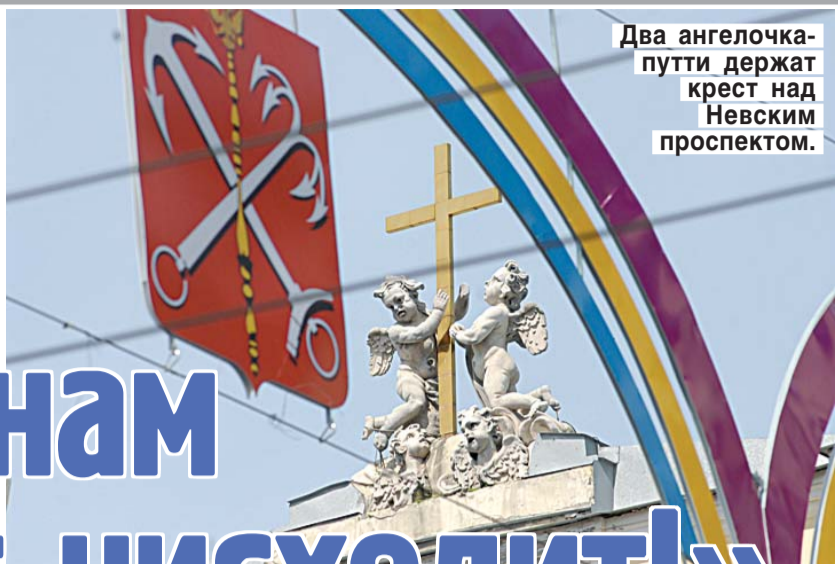
Два ангелочка-путти держат крест над Невским проспектом.