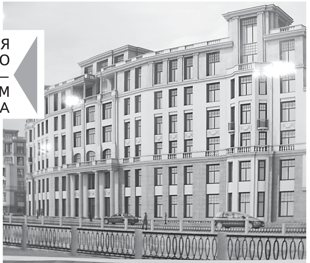
Комплекс выглядит благополучным буржуазным строением.

Этот массивный комплекс на Петроградской стороне — на набережной Карповки, 31, — самый беспрецедентный долгострой в исторической части Петербурга. Ему уже более 20 лет, и окончание строительства вновь отодвинуто на годы. На днях Градостроительный совет при правительстве Петербурга отклонил проект, повторно представленный ООО «Архитектурная мастерская Ясса».