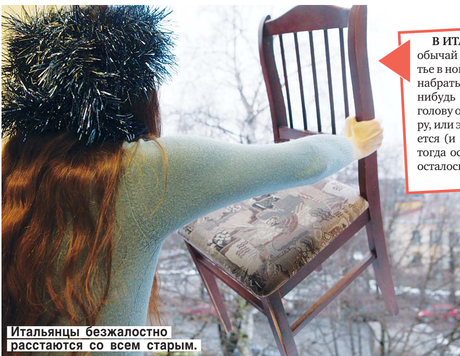
Итальянцы безжалостно расстаются со всем старым.