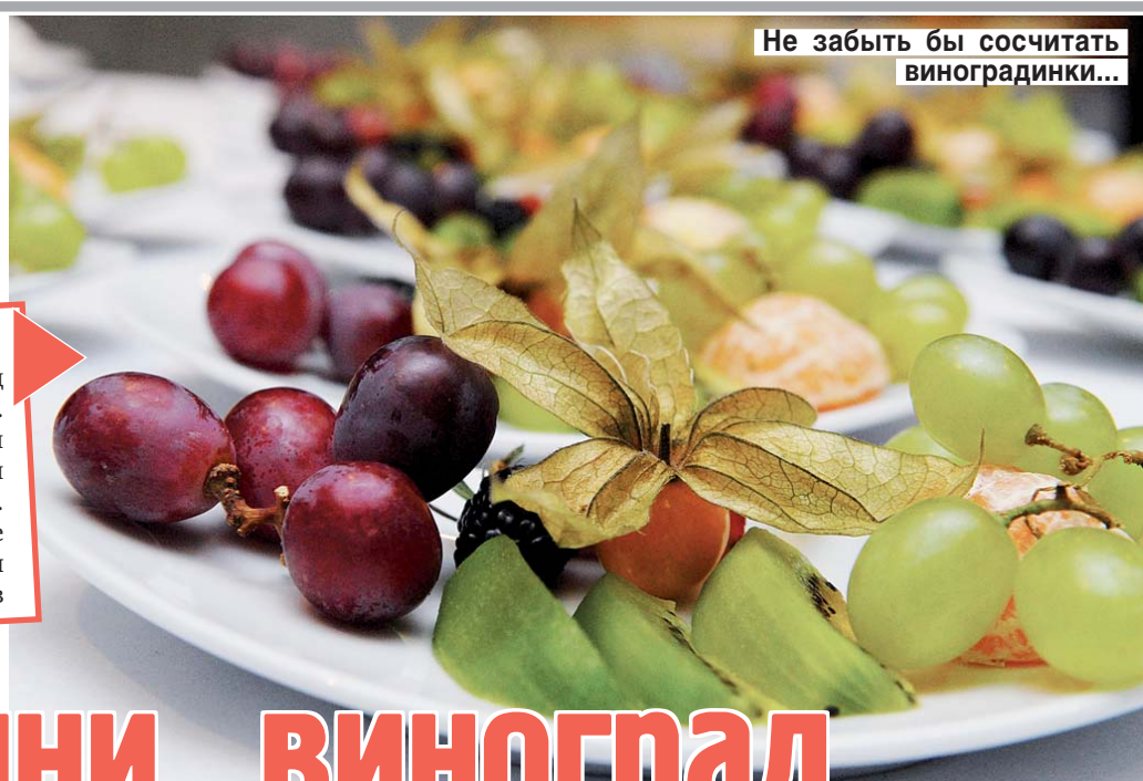
Не забыть бы сосчитать виноградинки...

В УЗБЕКИСТАНЕ , как и во всем мире, в Новый год, 1 Января, приходит Дед Мороз, только зовут его здесь Корбобо и возит его ослик, а Снегурочку зовут Коркиз. На новогоднем столе царит фруктовое изобилие. Обязательно подают арбуз: если он спелый и сладкий, то наступающий год будет счастливым. И уж точно исполнится загаданное желание, если съесть двенадцать виноградинок, пока часы бьют 12 раз. Узбекский обычай велит безжалостно разбить перед наступлением нового года все треснувшие или просто старые тарелки, тогда ничто плохое не сможет просочиться из старого года в наступающий. Еще один Новый год празднуют в Узбекистане в день весеннего равноденствия.