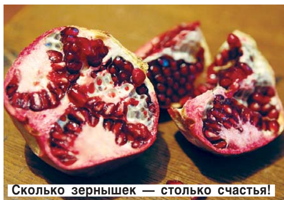
Сколько зернышек — столько счастья!

Вот, к примеру, В ГРЕЦИИ . Если идешь в гости на новогодний праздник, не забудь принести в подарок хозяйину дома камень потяжелее — бросишь его у порога и пожелаешь столько богатства, сколько весит этот камень! Это будет самым весомым доказательством дружбы. Правда, истинный грек непременно подкрепит свое новогоднее пожелание корзиной изысканных вин. А также, по традиции, принесет другу колоду новых карт. Хозяин дома, гарантируя своей семье в наступающем году счастье и удачу, ровно в полночь разобьет во дворе плод граната, да так, чтобы зернышки разлетелись во все стороны! Дети же, отправляясь спать, оставят у камина башмачки — в надежде, что добрый-предобрый святой Василий придет и заполнит их подарками.