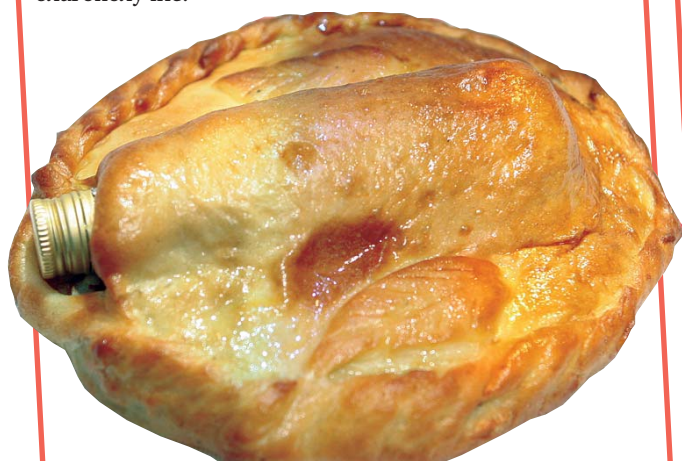
Пирог с сюрпризом по-болгарски.

В БОЛГАРИИ Новый год — это уютный семейный праздник. Если на празднике будет ребенок, его поставят около новогодней елки, чтобы он пел гостям колядки. Зато и подарков певец получит от взрослых немало. Как и в России, в Болгарии считают: чем богаче новогодний ужин, тем плодотворнее будет весь наступающий год. У болгар есть обычай в канун Нового года класть посреди стола буханку хлеба с запеченной в ней монеткой: каждый сидящий за столом ищет в своем куске монетку — нашедшего будет весь год сопровождать удача. В пироги для праздничного стола запекают сюрпризы-предсказания. В них — и здоровье, и любовь, и успехи. Когда часы бьют полночь, на три минуты выключают свет, и люди в темноте целуются. Так без слов желают друг другу любви, счастья и удачи в Новом году. После застолья дети и подростки играют кизиловыми палочками — сурвачками, «бьют» друг друга и старших родственников по спине. Такие «побои» сулят удачу, здоровье и благополучие.