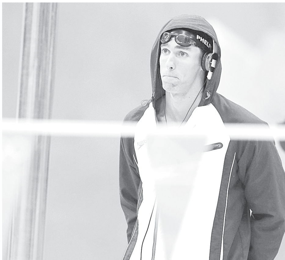
Многочратный олимпийский чемпион по плаванию не потерялся и на поле для гольфа.