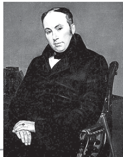
Этот портрет, написанный блистательным петербургским художником Карлом Брюлловым (1838), помог обрести свободу украинскому поэту Тарасу Шевченко.

По традиции мы прошли по адресам, связанным с жизнью поэта. Однако прогулка вызвала не только ностальгические воспоминания о былом, но и горькие мысли о настоящем. Петербург стремительно разрушается, теряя свое лицо и постепенно утрачивая свою душу. Уничтожаются не только дома, но целые кварталы, а вместе с ними — сама память о прошлом. А ведь память и ее святость для человека — один из главных мотивов поэзии Василия Андреевича Жуковского.