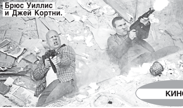
Брюс Уиллис и Джей Кортни.