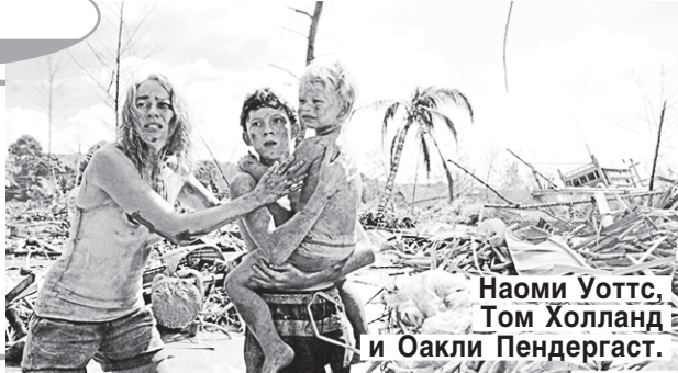
Наоми Уоттс, Том Холланд и Оакли Пендергаст.