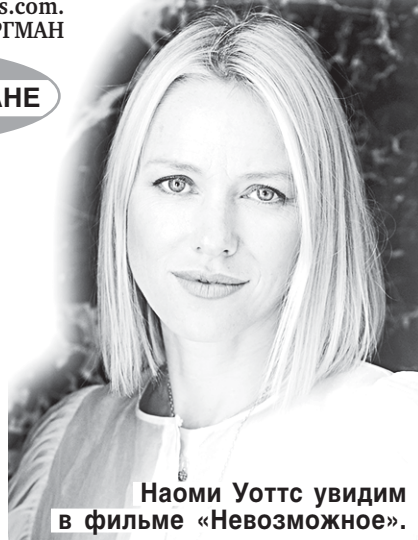
Наоми Уоттс увидим в фильме «Невозможное».

«Невозможное» — фильм, основанный на конкретной истории конкретной семьи, оказавшейся в Таиланде во время цунами 2004 года. Наоми Уоттс играет Марию — реальную женщину, которая решила рассказать о том, что пережили ее муж и сыновья в те несколько дней.