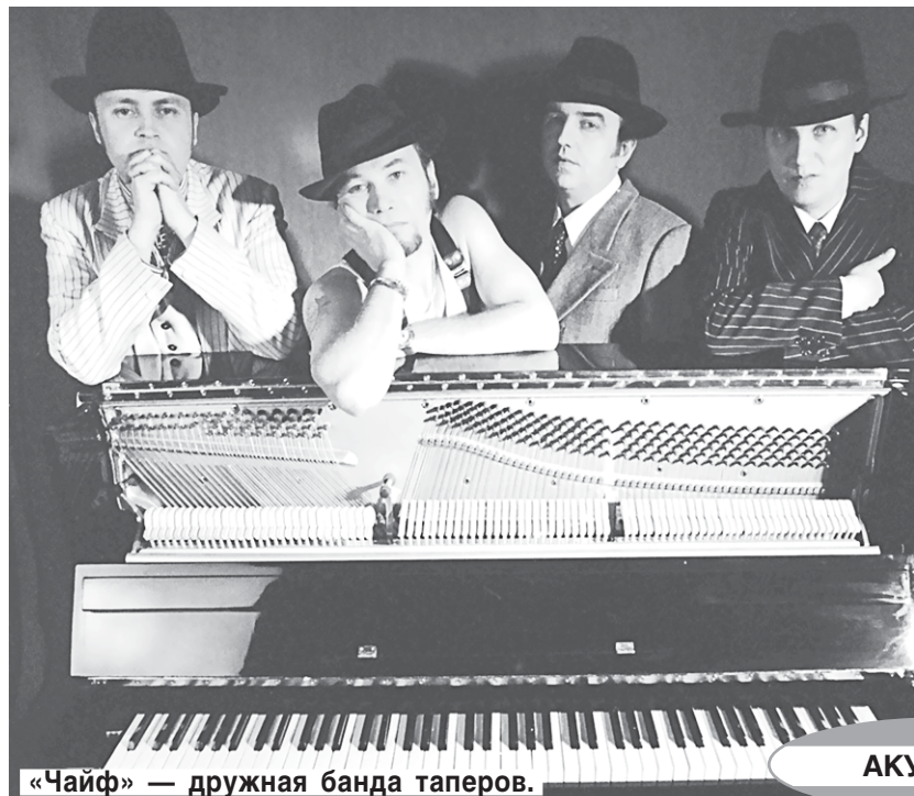
«Чайф» — дружная банда таперов.