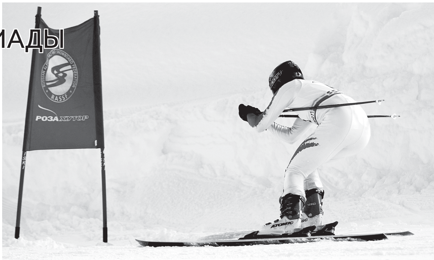
Основной комплект олимпийских наград разыгрывается в лыжных видах — 56 из 98.

«Недавно россияне могли бороться за медали в пяти дисциплинах, а теперь еще в шорт-треке, бобслее, санях, скелетоне, — добавил Владимир Куликов. — Если наши завоюют 10 золотых медалей, то они поборются за победу в командном зачете. Ведь в Ванкувере Канада выиграла 15 наград высшей пробы, Германия, занявшая второе место, — 10, ну а Норвегия и США — по 9».