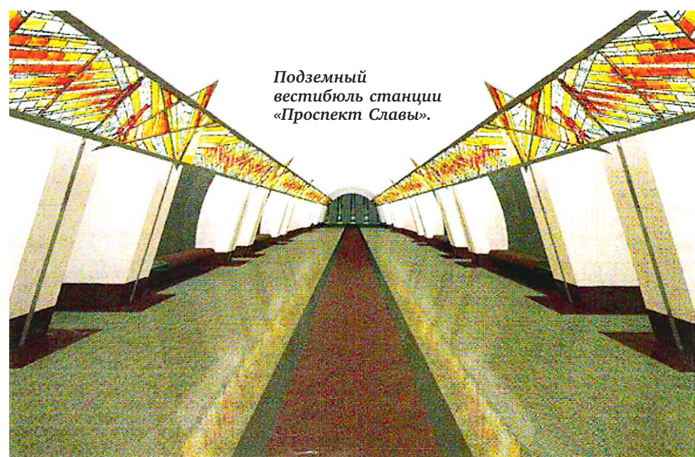
Подземный вестибюль станции «Проспект Славы».

Михаил ТЕЛЕХОВ Эскизы: «Ленметрогипротранс»