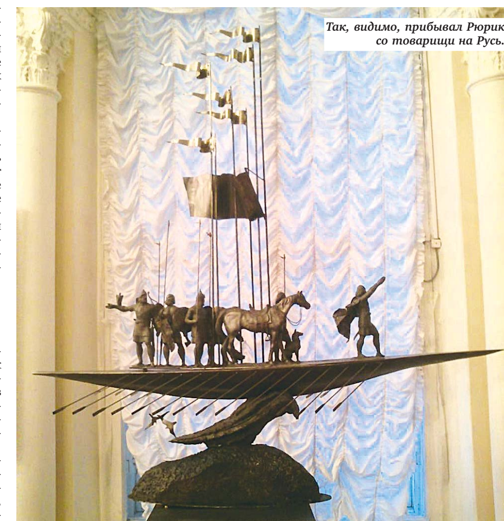
Так, видимо, прибывал Рюрик со товарищи на Русь.