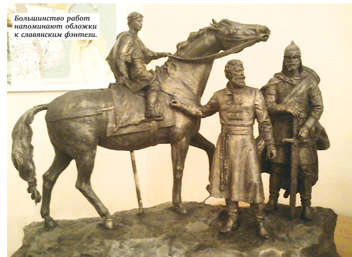
Большинство работ напоминают обложки к славянским фэнтези.

Пожалуй, именно от этой работы на меня повеяло каким-то по-настоящему глубоким чувством истории и той самой древности, которая живет в Старой Ладогге.