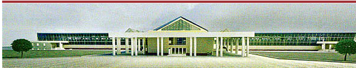
Павильон станции «Южная».