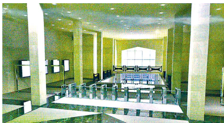
Вестибюль станции «Южная».