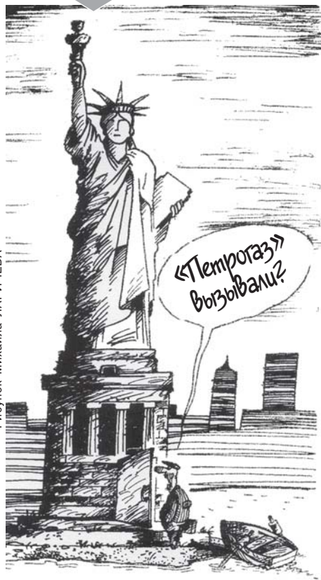
Рисунок Михаила Ларищева

В ПЕТЕРБУРГЕ продолжают промышлять квартирные мошенники, обманывающие пенсионеров. Схема — классическая. Звонят в дверь. Представляются коммунальщиками. Проникают внутрь. А дальше — дело техники и фантазии.