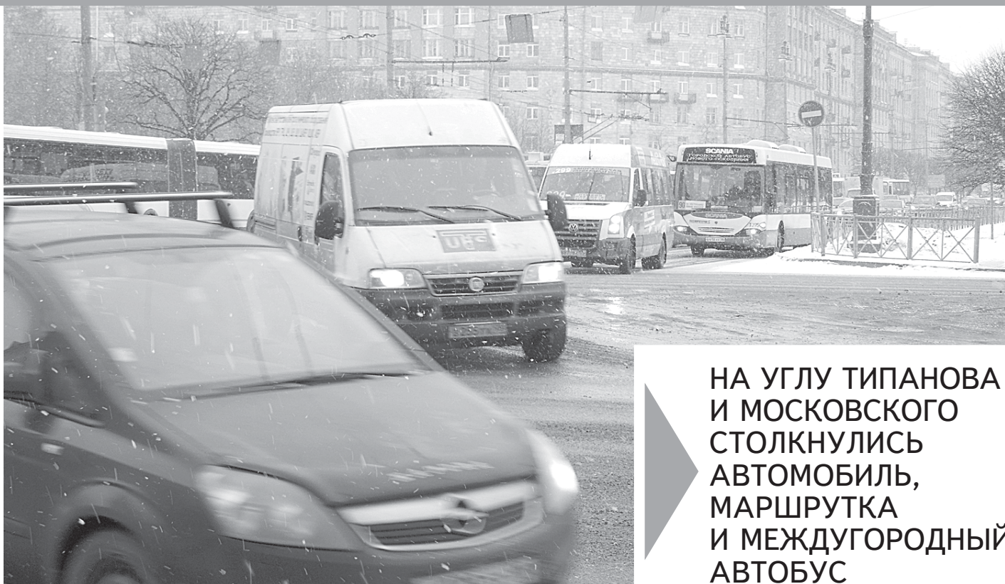
Перекресток улицы Типанова и Московского проспекта давно снискал дурную славу.