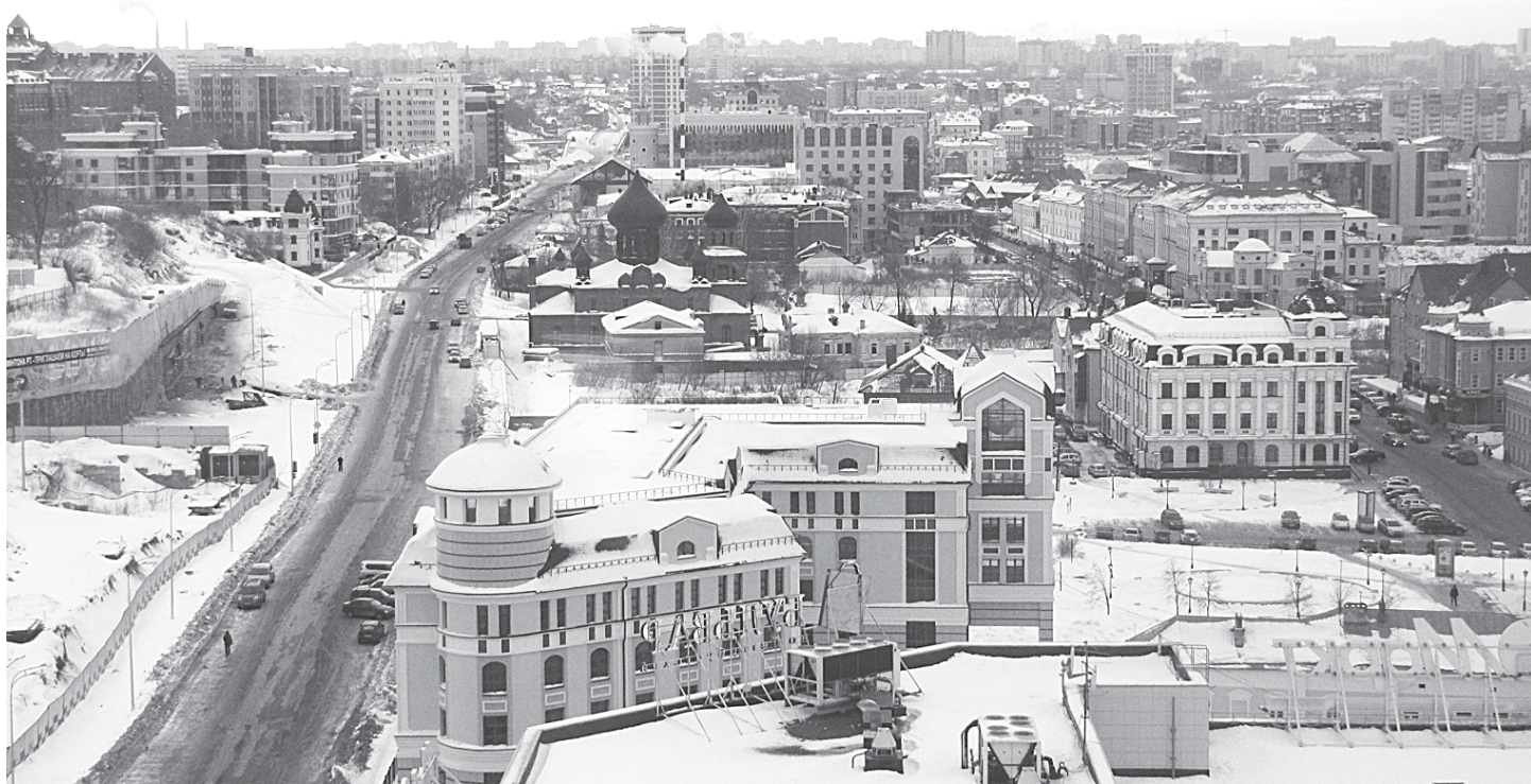
К Универсиаде облик столицы Татарстана должен преобразиться.

Казань олимпийскими темпами готовится к Универсиаде. Когда пару лет назад столицу Татарстана оценили с точки зрения привлекательности для гостей «студенческой Олимпиады», пришли в ужас: от старой, купеческой Казани практически ничего не осталось. Многие пошло под снос во время реализации программы по расселению ветхого жилья, что-то разрушилось без посторонней помощи. На иные здания, представляющие историческую и архитектурную ценность, не посягали даже лица без определенного места жительства.