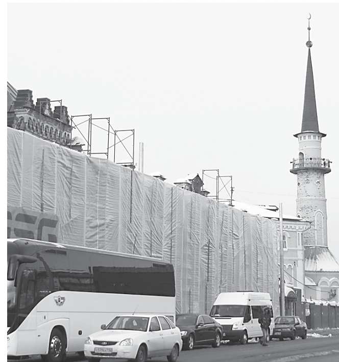
В историческом центре Казани фасады многих зданий скрыты за строительной пленкой.

Ирина ВАСИЛЬЕВА, корреспондент БалтИнфо, специально для «Вечернего Петербурга»