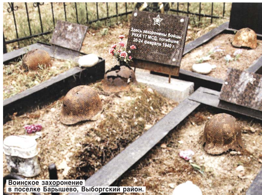
Воинское захоронение в поселке Барышево, Выборгский район.