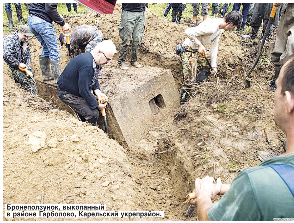
Бронеползунок, выкопанный в районе Гарболово, Карельский укрепрайон.