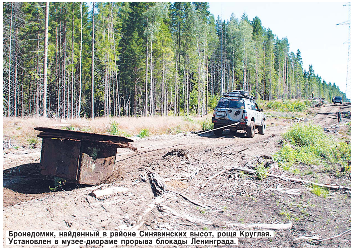
Бронедомик, найденный в районе Синявинских высот, роща Круглая. Установлен в музее-диораме прорыва блокады Ленинграда.