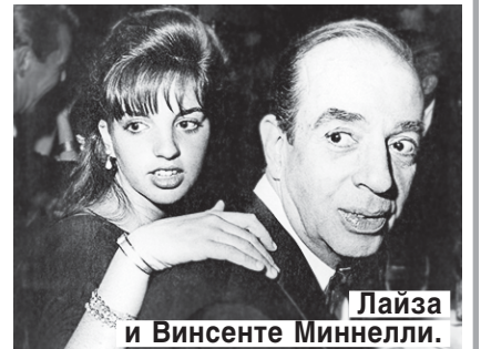
Лайза и Винсенте Миннелли.

100 (1913) — родился Винсенте МИННЕЛЛИ, американский кинорежиссер, отец Лайзы.