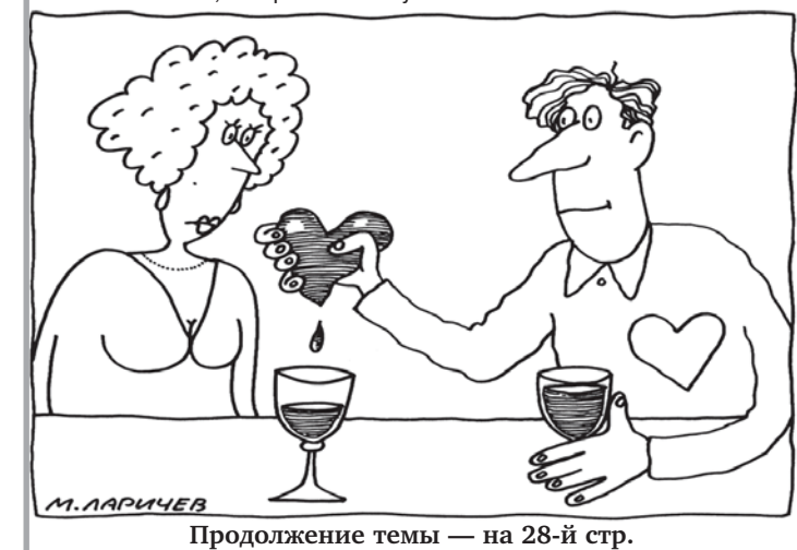
Продолжение темы — на 28-й стр.

Собирает мужчина все свое большое мужское мужество, чтобы раз в году оценить женское, как сказано у поэта, «маленькое мужество причесок, маникюра, щипчиков, ресниц...». Успеха тебе, собрат по полу!..