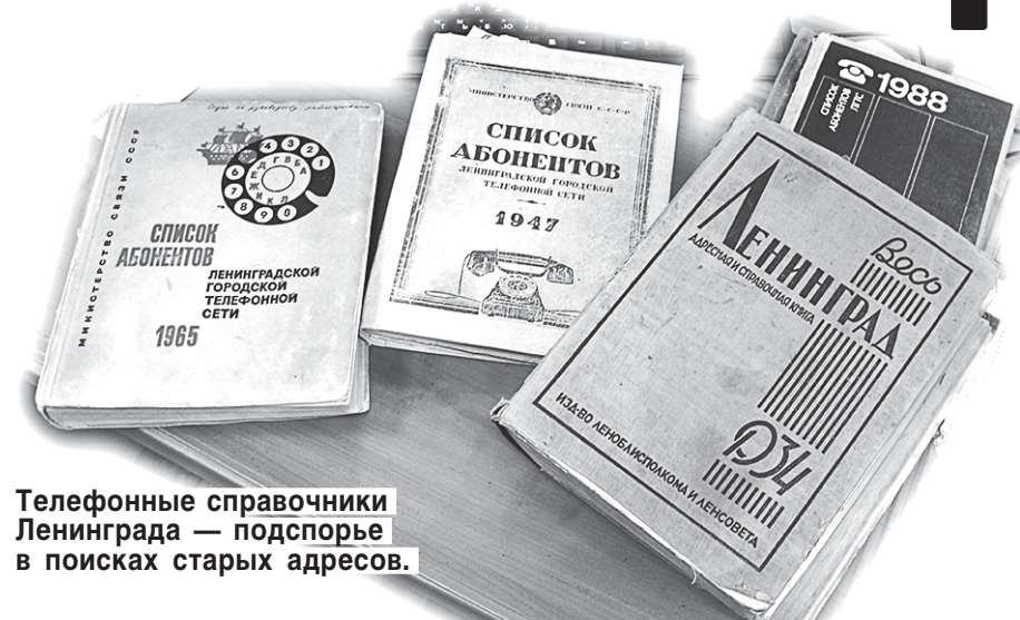
Телефонные справочники Ленинграда — подспорье в поисках старых адресов.