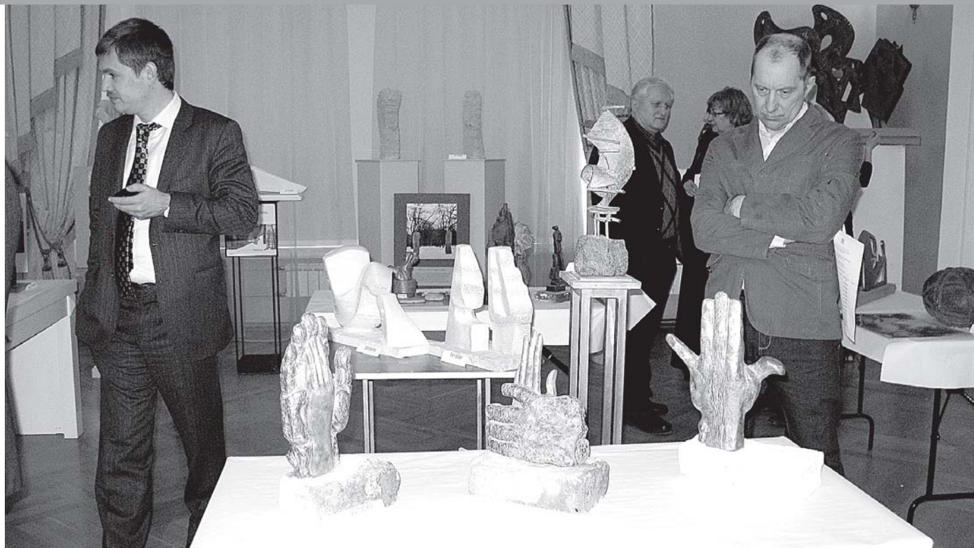
Из более чем ста работ жюри предстояло выбрать восемь победителей.