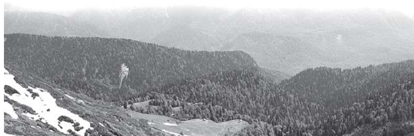
В самом ли деле виагра полезна на высокогорье, неизвестно.