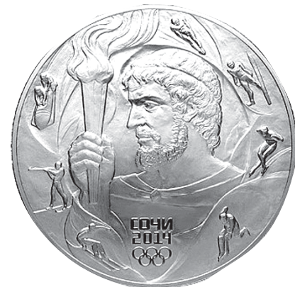
Золотая монета «Прометей» номиналом 10 000 рублей.

В рамках этой серии изготовят также и монеты из недорогих металлов номиналом 25 рублей. Но это — в скором будущем. А остальные олимпийские рубли коллекционеры уже могут искать.