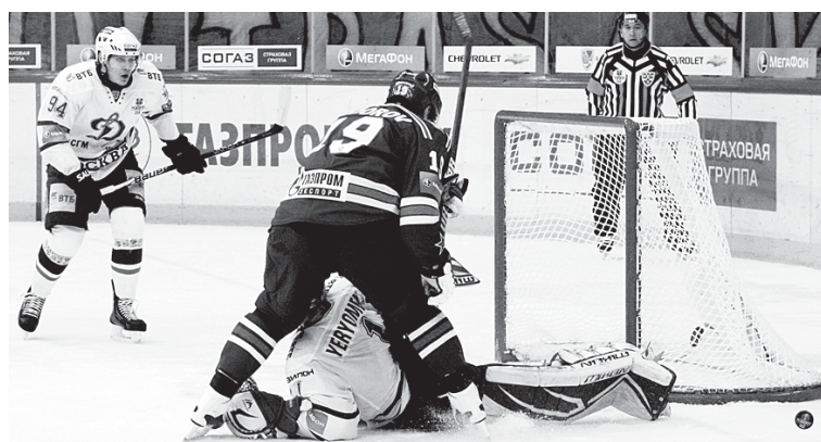
«Динамо» позиций не уступает.

КАК И ГОД НАЗАД, ОБА ДОМАШНИХ МАТЧА ПОЛУФИНАЛЬНОЙ СЕРИИ КУБКА ГАГАРИНА НАША КОМАНДА ПРОИГРАЛА ТОМУ ЖЕ «ДИНАМО» (2:3, 2:4)