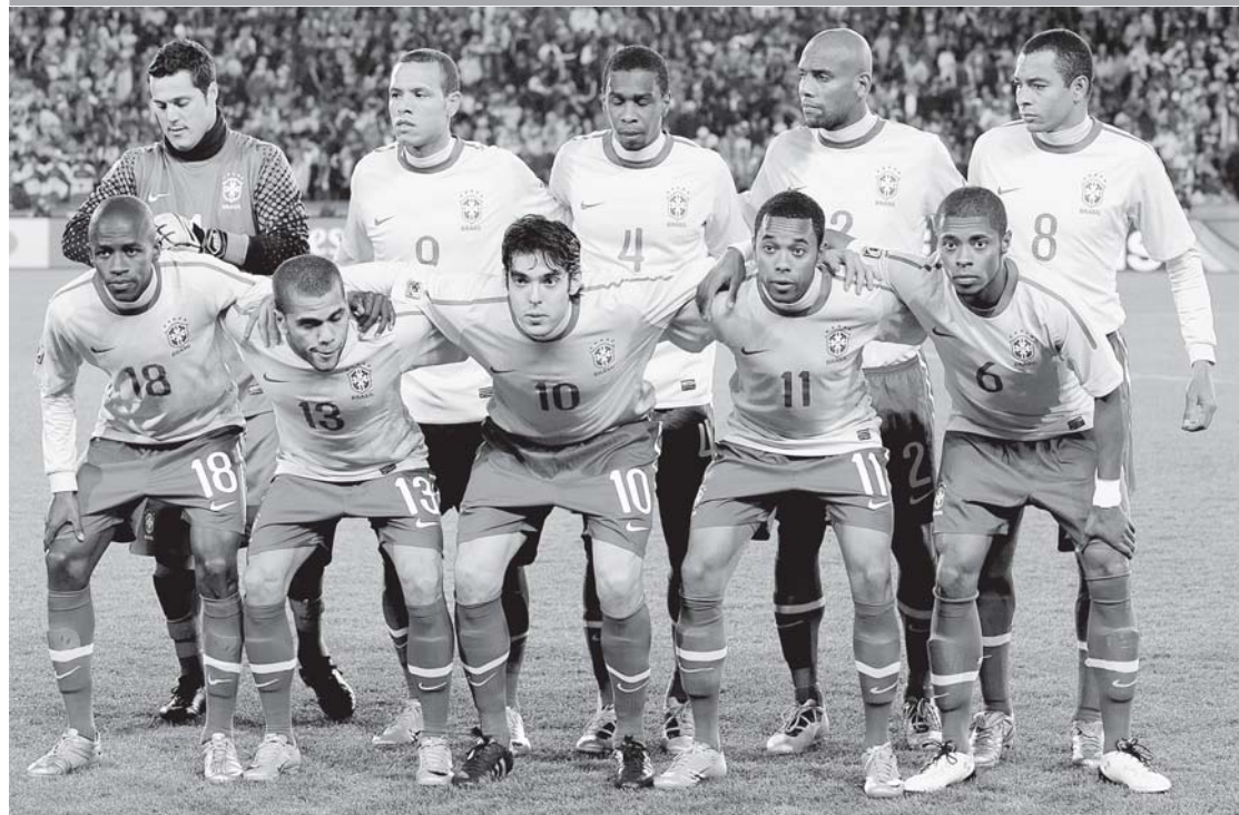
Эти ребята и на футбольном поле могут устроить карнавал.