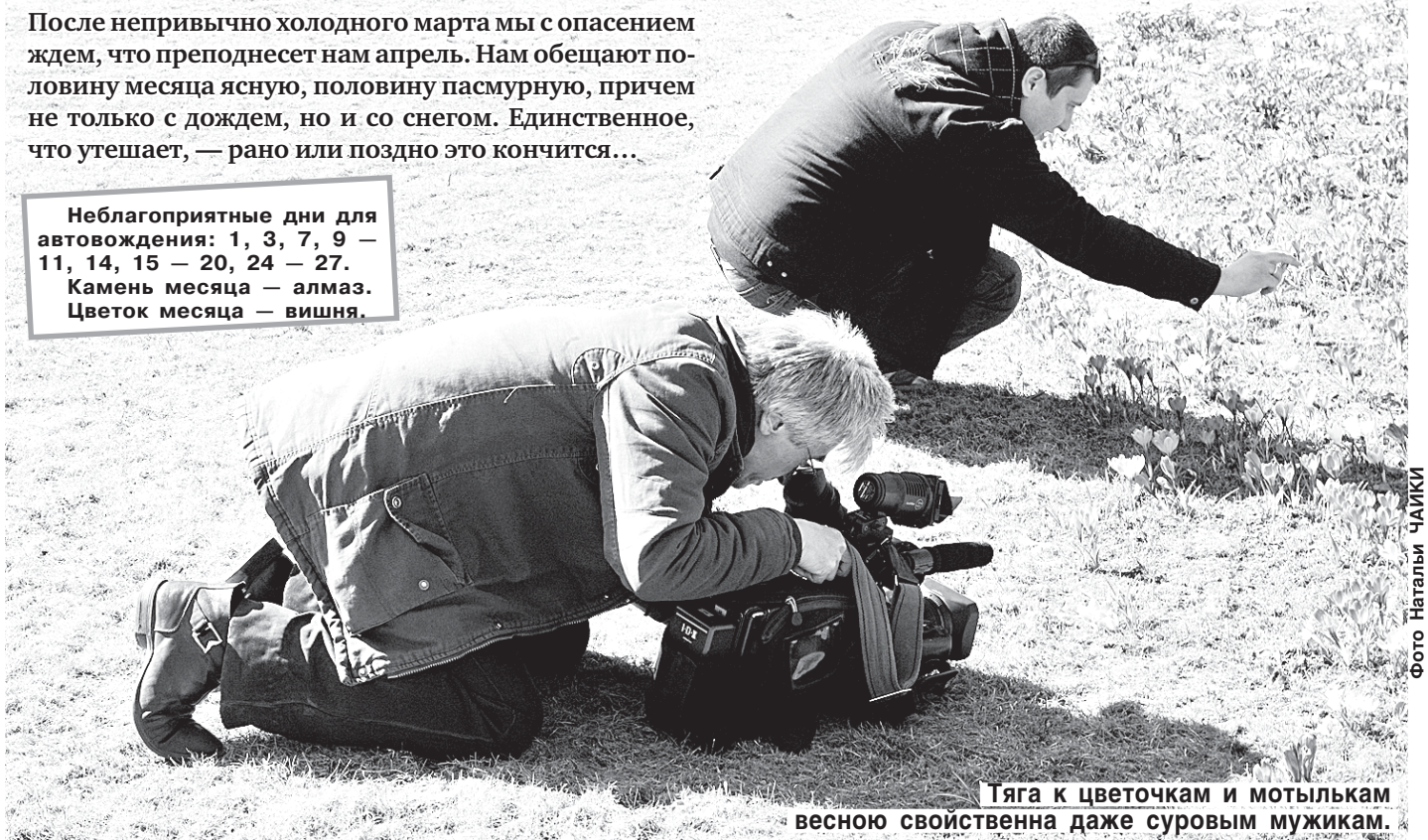
Тяга к цветочкам и мотылькам весной свойственна даже суровым мужикам.

Неблагоприятные дни для автовождения: 1, 3, 7, 9 — 11, 14, 15 — 20, 24 — 27. Камень месяца — алмаз. Цветок месяца — вишня.