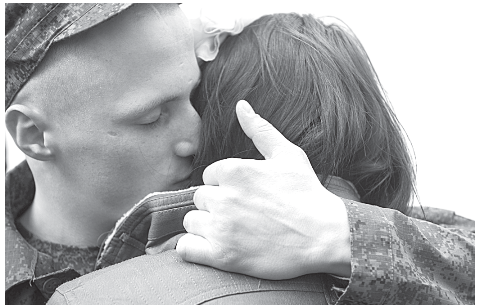
Ждать год парня из армии — не такое уж тяжкое испытание.

Призывники традиционно прошли заключительный медицинский осмотр, дактилоскопию. Получили военную форму — летний и зимний комплекты, ботинки, вещмешок, гигиенические принадлежности. Большинство из них (99%) останутся на территории ЗВО — в частях сухопутных войск от Калининграда до Нижнего Новгорода и от Мурманска до Белгорода. Кто-то отправится в матросы — на Балтийский или Северный флот.