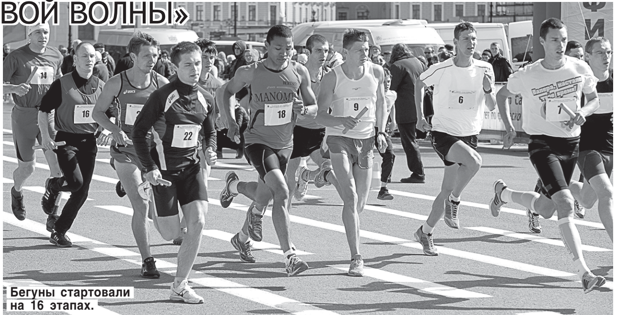
Бегуны стартовали на 16 этапах.

На этот раз с погодой повезло. И это к лучшему — ведь многие спортшколы и спортклубы Питера выставили аж по три состава. Всего почти 750 энтузиастов примерно