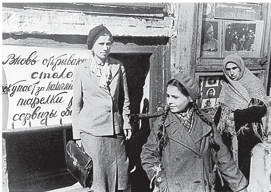
Перед открытием спецстоловой для дистрофиков.

вен в полроста. Как в старые времена на фортах.