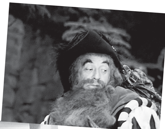
Карабас-Барабас в фильме «Приключения Буратино».