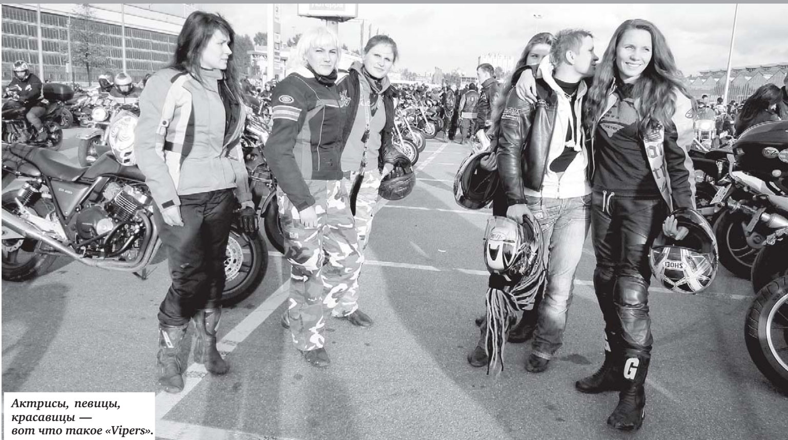
Актрисы, певицы, красавицы — вот что такое «Vipers».

С наступлением тепла, а значит, и мотосезона на улицы выехали байкеры. Среди них и представительницы женского объединения «Vipers». Корреспондент «ВП» встретился с его организатором и выяснил, сколько всего девушек-байкеров в Северной столице, что их заставляет садиться в седло и почему женские мотоклубы — это утопия.