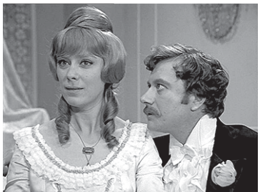
Билеты предоставлены сетью кинотеатров

Звоните во вторник, 14 мая, с 13.00 до 14.00 по тел. 334-35-65. Победителей конкурсов просим ЗВОНИТЬ с понедельника по четверг с 13 до 19 часов. Ведущая конкурсов — Татьяна КИРИЛЛИНА