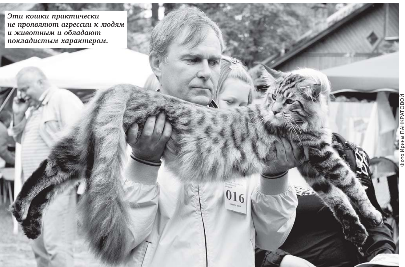
Эти кошки практически не проявляют агрессии к людям и животным и обладают покладистым характером.

ЗНАЕТЕ, КАКАЯ КОШКА САМАЯ ТЯЖЕЛАЯ? ЭТО МЭЙН-КУН. ОНА ВЕСИТ ДО 15 КГ И МОЖЕТ СТАТЬ МЕЧТОЙ ДЛЯ КРЕПКИХ МУЖЧИН НА ОГРОМНЫХ ДЖИПАХ. НУ НЕ ФИТЮЛЬКУ ЖЕ ИМ КАКУЮ-НИБУДЬ ЗАВОДИТЬ!