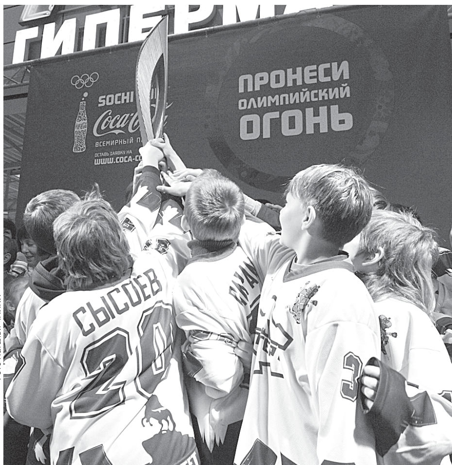
Пронести олимпийский огонь по улицам Петербурга — большая честь.