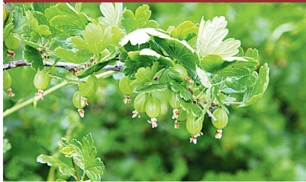
Крыжовник — зеленый и мелкий. Но это только пока. Большой урожай еще впереди.