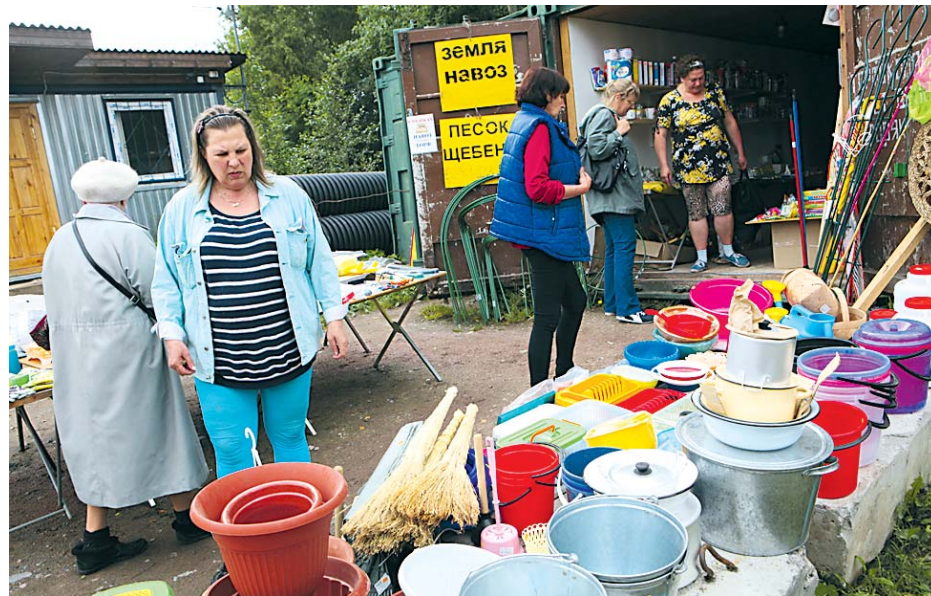
Садоводы, налетай! Кому кастрюли да ведра по сходной цене?

— Наша главная проблема — состояние дороги от Мурманского шоссе до въезда в садоводство. Это примерно километр. И он ничейный, ни в какой организации на балансе не чис-