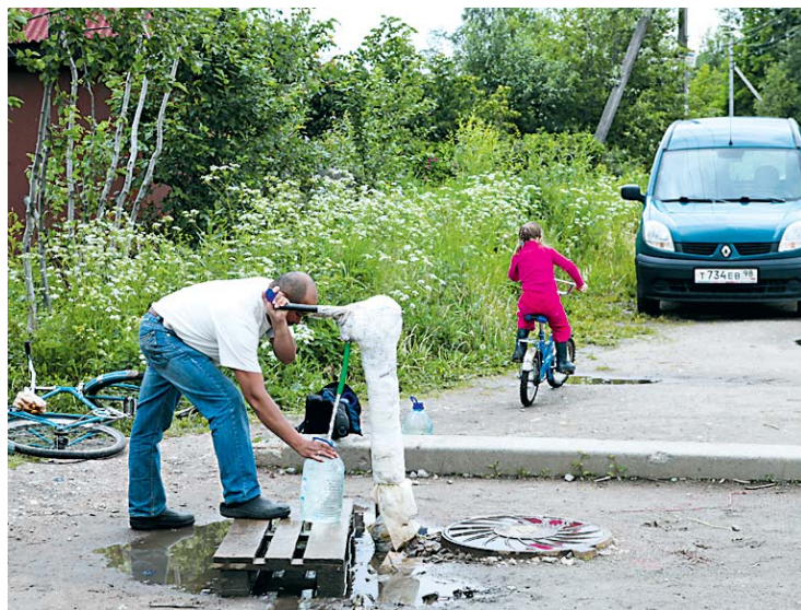
Вода из колонки — чистойшая, никаких личных колодцев не нужно.

Бурлит жизнь в наших садоводствах. Само собой, летом на родную дачу спешат не только пенсионеры, но и дети, и работающие граждане. По примерным подсчетам, на один участок летом приходится три-четыре, а то и более проживающих. Если учесть, что в Санкт-Петербурге и Ленинградской области число садовых участков — более 600 тысяч и еще 80 тысяч огородов, цифра получается внушительная. Как ни крути, но не менее двух миллионов петербуржцев выезжают на свои шесть соток.