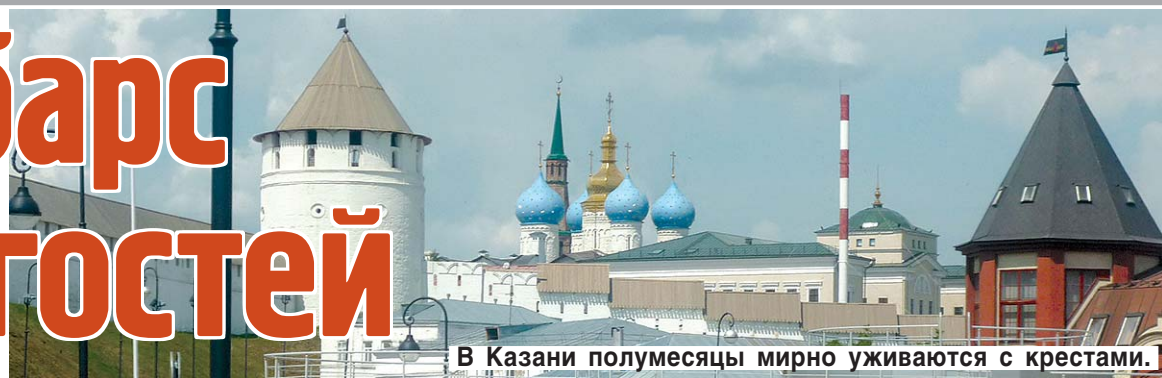
В Казани полумесяцы мирно уживаются с крестами.

ЗАВТРА В КАЗАНИ СТАРТУЕТ XXVII ВСЕМИРНАЯ ЛЕТНЯЯ УНИВЕРСИАДА. НАШ ОБОЗРЕВАТЕЛЬ Светлана ЯКОВЛЕВА ПОБЫВАЛА В СТОЛИЦЕ ТАТАРСТАНА ВО ВРЕМЯ ПОДГОТОВКИ К ПРАЗДНИКУ СПОРТА