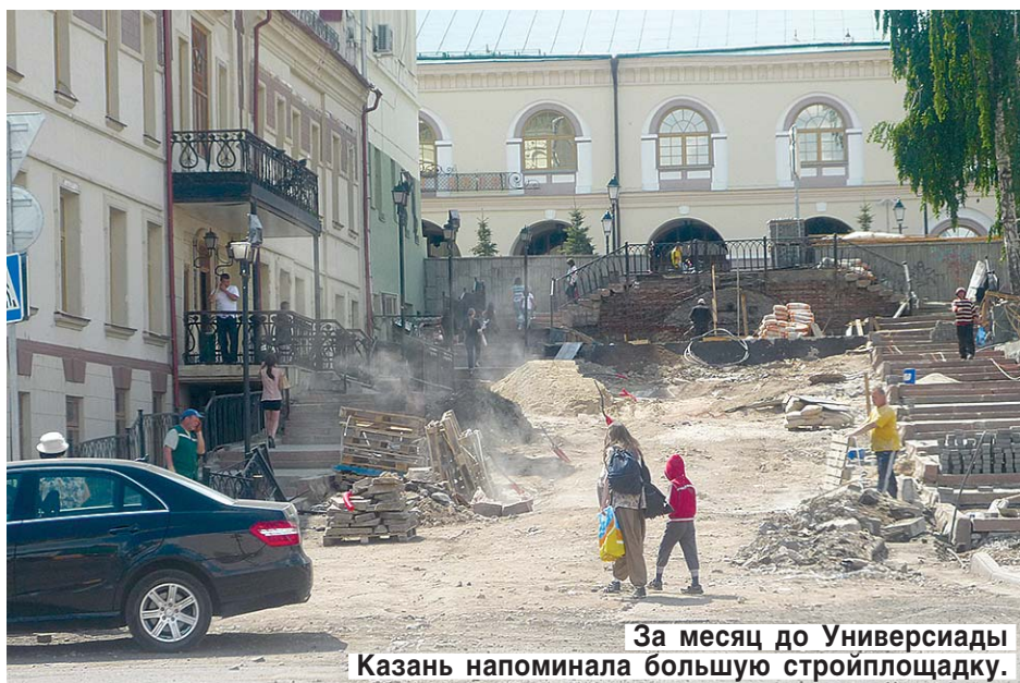
За месяц до Универсиады Казань напоминала большую стройплощадку.