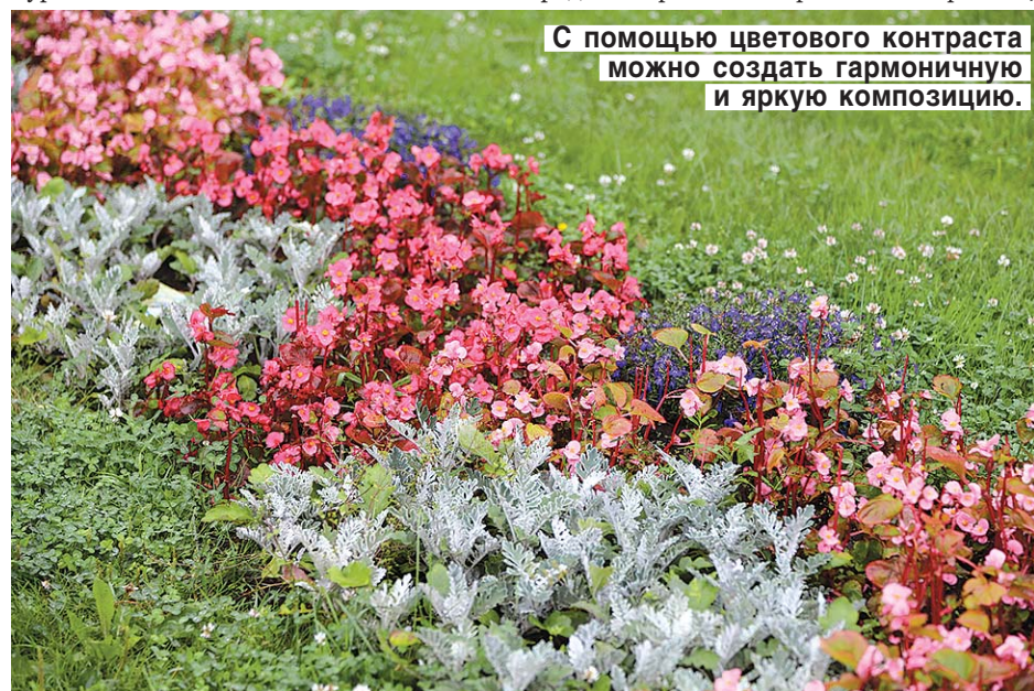
С помощью цветового контраста можно создать гармоничную и яркую композицию.

Кроме гармоничных цветовых сочетаний существуют и негармоничные (дисгармоничные) — фиолетовый и красный, синий и зеленый, красный и оранжевый. Их можно нейтрализовать ароматическим цветом. Например, на границе сочетания цветов вводят белый, серый или серебристый.