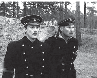
Билеты предоставлены сетью кинотеатров

Звоните в понедельник, 8 июля, с 13.00 до 14.00 по тел. 334-35-64. Победителей конкурсов просим ЗВОНИТЬ с понедельника по четверг с 13 до 19 часов. Ведущая конкурсов — Татьяна КИРИЛЛИНА