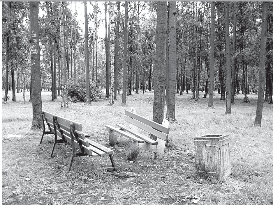
Благоустройство в парке сводится к немногим разбитым скамейкам.