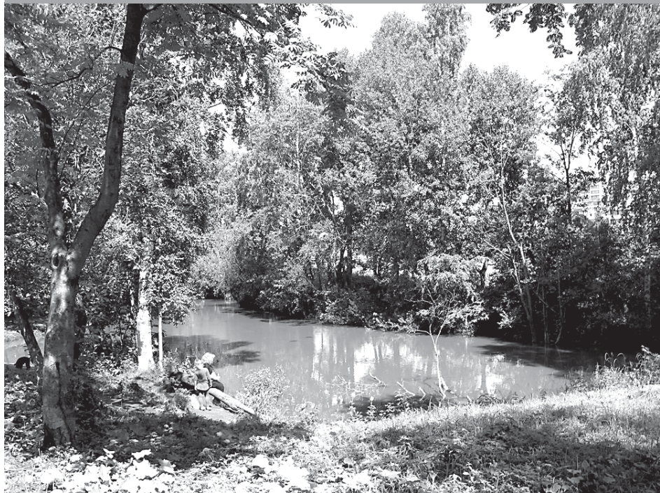
Берега Оккервиля заросли, воды — мутны.