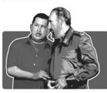
Чавес и Фидель Кастро

► 2000, 30 июня Чавес переизбран, набрав 80% голосов, его движение получило почти половину мест в Нац. Собрании ► Укрепляет связи с Кубой, поставляет туда нефть по низкой цене