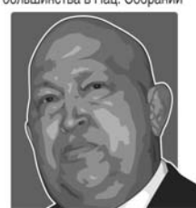
Президент Уго Чавес (58)

► 26 сент. Правящая Объединенная социалистическая партия Венесуэлы (ОСПВ) не смогла получить абсолютного большинства в Нац. Собрании