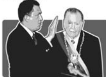
Чавес и Рафаэль Кальдера

► 1999, 2 фев. Получивший на выборах 56,2% голосов Чавес приведен к присяге как президент