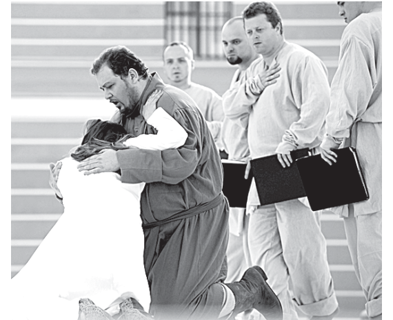
Фестиваль «Опера — всем» откроется «Жизнью за царя».