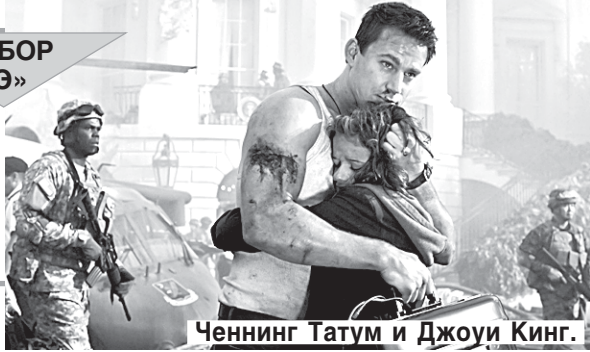
Ченнинг Татум и Джоуи Кинг.