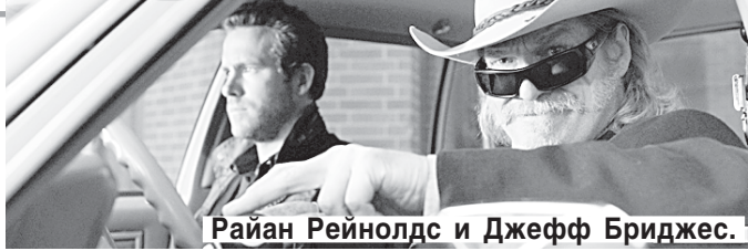
Райан Рейнолдс и Джефф Бриджес.