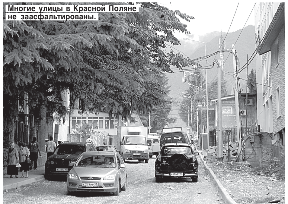
Многие улицы в Красной Поляне не заасфальтированы.