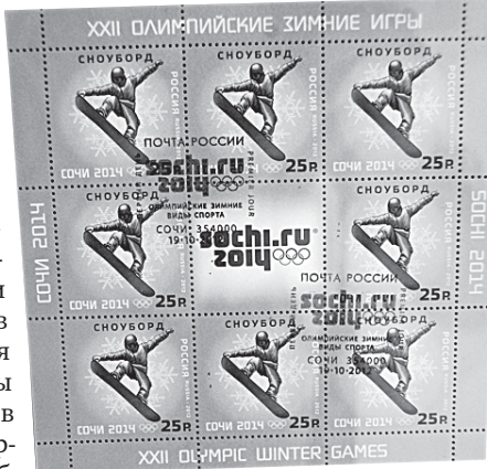
Сноуборд. Один из видов спорта, представленных на олимпийских марках.

ально относящихся к Большому Сочи (в Хосте и Кудепсте, возле Адлера), не было газа и воды. Газ, шутили жители, уходил в