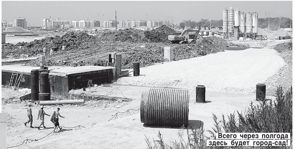
Всего через полгода здесь будет город-сад!

Работы в предолимпийском Сочи ведутся на трех основных участках (кластерах): прибрежном (Имеретинская низменность, поселок Мирный), горном (Красная Поляна) и в самом центре Сочи.