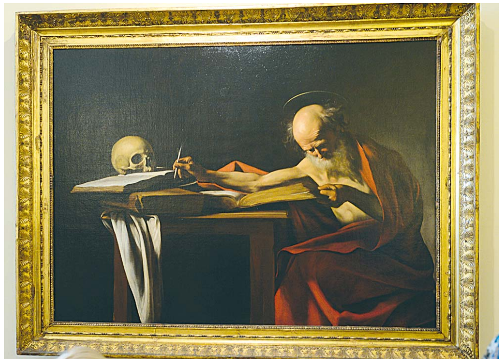
Караваджо. Святой Иероним.