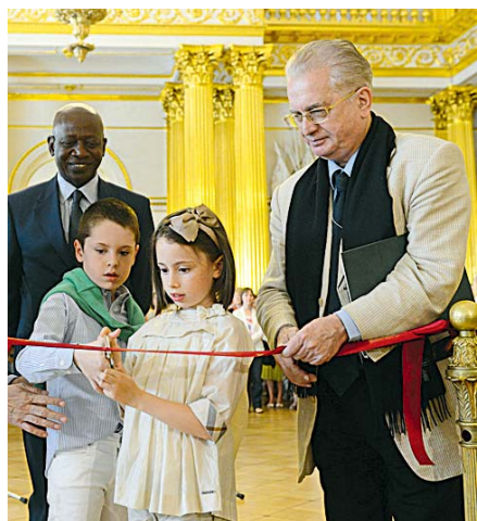
Открытие такой выставки — праздник не только для музея, но и для всего города.

Мы взяли за основу хронологию собрания Маона, а его увлечение живописью Италии XVII века началось именно с Гверчино. Затем он вернул миру живопись барокко, которую до него не особенно ценили, а благодаря ему стали ценить очень высоко. Многие работы, приписываемые неизвестным художникам, он атрибутировал. Он обладал удивительным глазом, вкусом, умением и знаниями. Он собирал картины своих любимых художников, а потом, когда ввел их в научный искусствоведческий оборот и они стали стоить миллионы, не продал, а подарил музеям Великобритании, Ирландии и Италии. Причем сделал это так, чтобы избавить музеи от непомерных налоговых выплат за наследство. Самые лучшие и щедрые меценаты — это не банкиры и олигархи, а ученые, искусствоведы и художники. У нас в Главном штабе хранится «Красная дверь» Ильи Кабакова, обладающая ас-