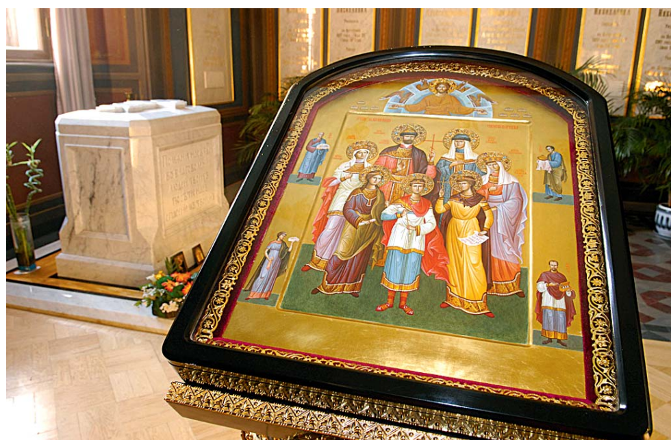
Захоронение останков царской семьи в Петропавловском соборе.

И СПУСТЯ 95 ЛЕТ ПОСЛЕ ГИБЕЛИ СЕМЬИ НИКОЛАЯ II НЕЯСНО, ГДЕ ПОКОЯТСЯ ИХ ОСТАНКИ