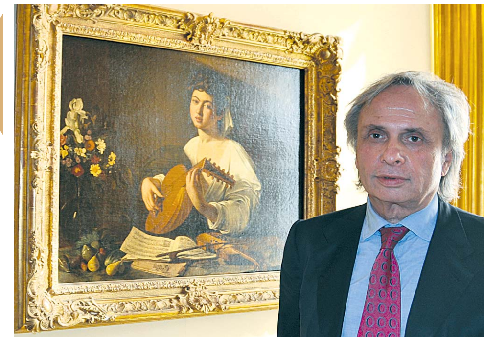
Синьор Челли и «Лютнист» Караваджо.