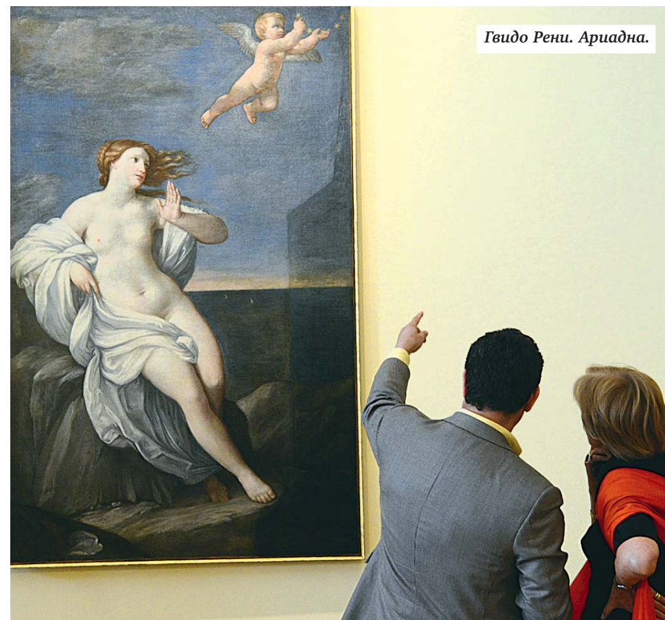
Гвидо Рени. Ариадна.

В ГЕРБОВОМ ЗАЛЕ ЭРМИТАЖА ОТКРЫЛАСЬ ДОЛГОЖДАННАЯ ВЫСТАВКА ИТАЛЬЯНСКОГО ИСКУССТВА «ОТ ГВЕРЧИНО ДО КАРАВАДЖО»