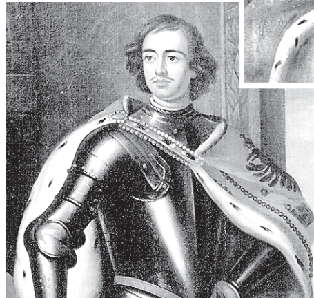
«Поневолили-то мóлодца жениться...» Семья русского младшего царя: Петр Алексеевич (1672 — 1725) и Евдокия Феодоровна (1669 — 1731).