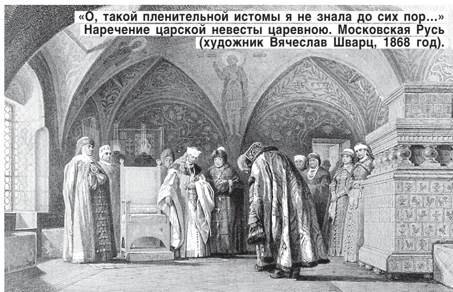
«О, такой пленительной истомы я не знала до сих пор...» Наречение царской невесты царевною. Московская Русь (художник Вячеслав Шварц, 1868 год).

Однако Екатерина вспоминала ту зиму не без удовольствия. Скучать доводилось меньше прежнего, и даже надоевший недуг не мешал резвиться вместе с молодыми повесами, являвшимися в свите Петра Феодоровича проводить великую княгиню. Среди гостей были Петр Девиер («доверенное лицо» Елизаветы Петровны), граф Сергей Салтыков (дальняя родня царицы Прасковьи), гвардейский офицер Петр Репнин (племянник Василия Никитича) и трое Александров — Вильбуа, Голицын и Трубецкой. Все — а старшему не стукнуло и тридцати — от души прыгали, скакали, танцевали, играли в жмурки. Иногда наслаждались концертами, после чего сытно и вкусно ужинали. Дважды в неделю веселая компания отправлялась в театр, стоявший на Невском проспекте напротив Казанской церкви. Разделить радость золотой молодежи приходили порою и сановники «большого Двора».