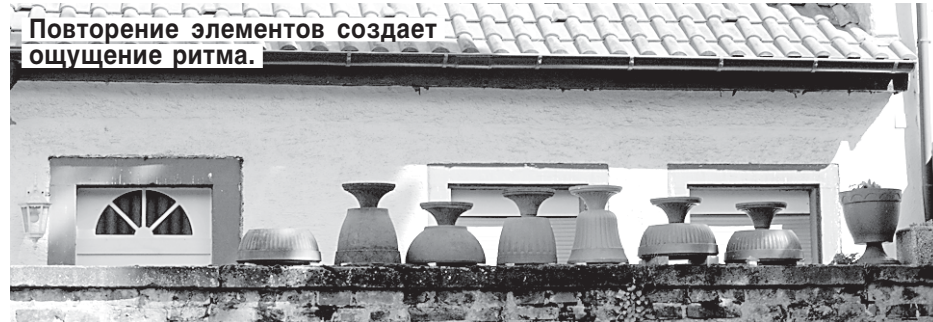
Повторение элементов создает ощущение ритма.

● Нельзя забывать и о РИТМЕ. Ритм — это повторяемость отдельных элементов и расстояний между ними. Самый простой пример — аллея. Устойчивое впечатление ритма возникает при повторении элементов 5 — 8 раз. При увеличении числа элементов воздействие ритма усиливается, но в какой-то момент наступает ощущение монотонности. Чтобы этого не произошло, надо разнообразить ритмический ряд: изменять расстояния между деревьями, включать цветники. Простой ряд из одного вида кустарников также можно разнообразить цветами, можно чередовать плодовые деревья с ягодниками — все зависит от фантазии, художественного вкуса и вдохновения.