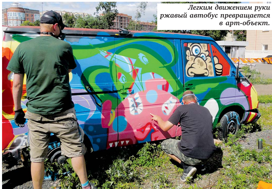
Легким движением руки ржавый автобус превращается в арт-объект.

«НАСТОЯЩИЙ ХУДОЖНИК НЕ СТАНЕТ РАЗРИСОВЫВАТЬ ИСТОРИЧЕСКОЕ ЗДАНИЕ!»