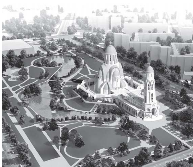
Эскиз проекта. Журнал «Капиталь» №2/2011 г.

Основанием для строительства мегахрама было разрешение, выданное Смольным общине с Пискаревки весной 2011 года. Публичные слушания проекта планировки и проекта межевания территории прошли в апреле 2011 года. Как мы уже сообщали, на слушаниях была представлена просьба прихода, подержанная подписями 150 жителей Красногвардейского района. Возражений против выделения участка приходу в протоколе слушаний зафиксировано не было. Однако в 2013 году жителями Красногвардейского района было собрано 10 тысяч подписей против инициативы, поступившей из соседнего Калининского района, в котором расположен приход на Пискаревском.