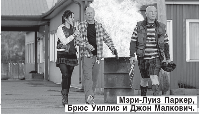
Мэри-Луиз Паркер, Брюс Уиллис и Джон Малкович.

Режиссер — Дин Паризо. В ролях: Брюс Уиллис, Джон Малкович, Мэри-Луиз Паркер, Кэтрин Зета-Джонс, Ли Бён Хон, Энтони Хопкинс, Хелен Миррен. США, 2013. КОМЕДИЙНЫЙ БОЕВИК. Новые приключения Фрэнка Мозеса и его разношерстной команды вышедших на пенсию убийц.