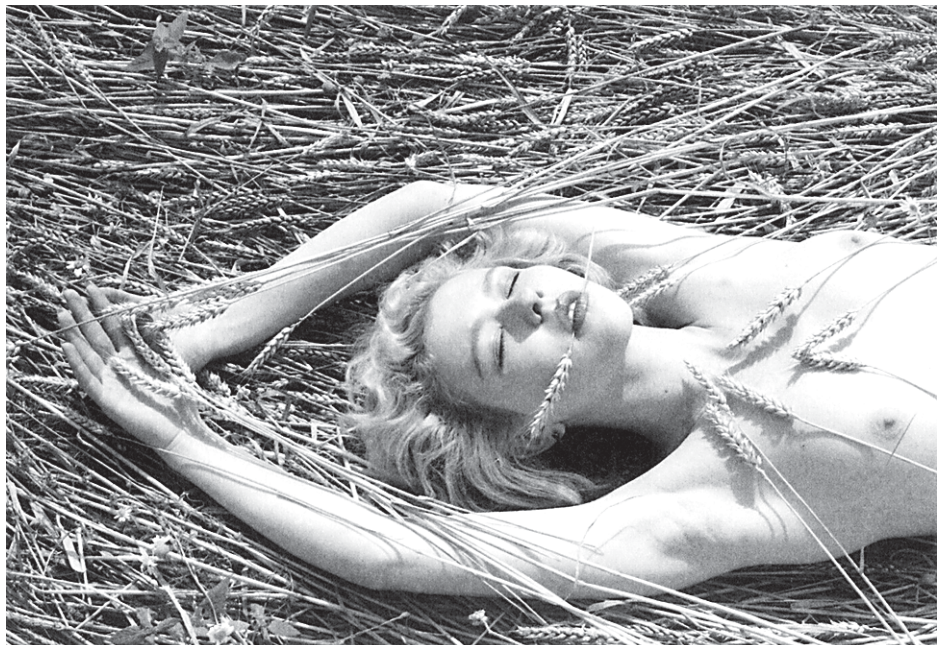
Андрей Князев. Из серии ню. 1990-е гг.

МУЗЕЙ ИДЕТ НАВСТРЕЧУ НАРОДУ И В ЧЕТВЕРГ, 1 АВГУСТА, ОТКРЫВАЕТ В СТРОГАНОВСКОМ ДВОРЦЕ ВЫСТАВКУ С ВОПРОСИТЕЛЬНЫМ НАЗВАНИЕМ «КРАСОТА БЕЗ ГЛАМУРА?»