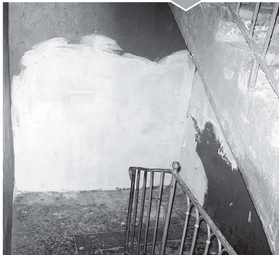
...и после круглого стола.