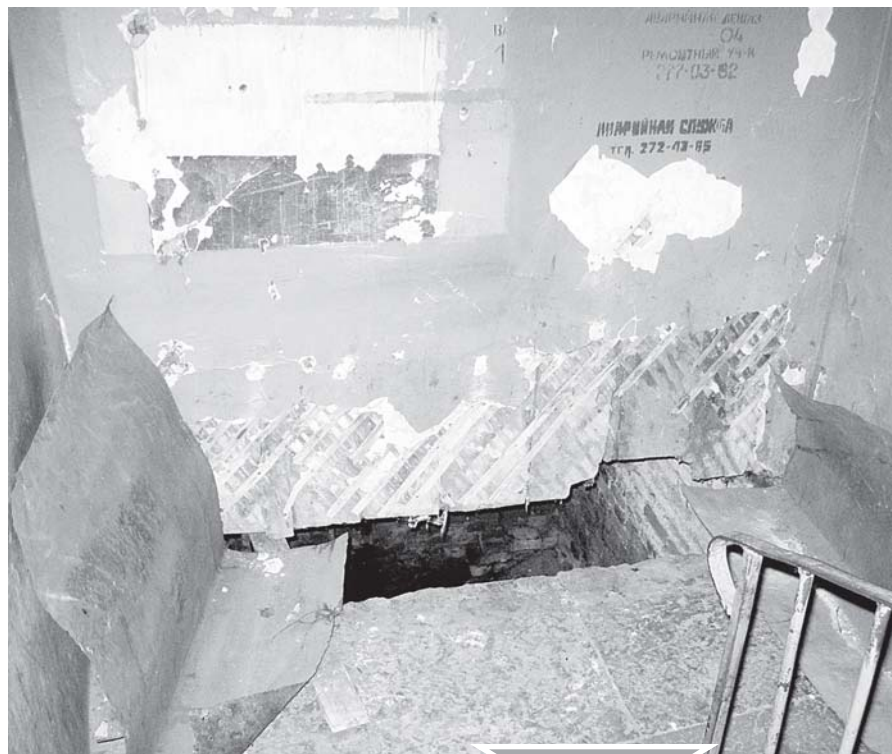
Подъезд на Моховой до круглого стола...